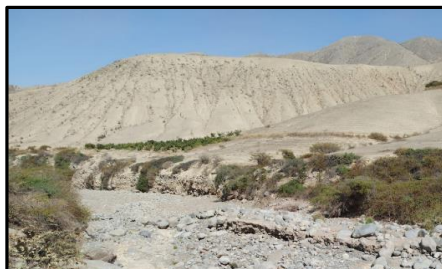
Fot N°01 Rio sin encauzamiento