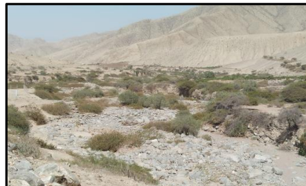
Fot N°02 Rio sin encauzamiento